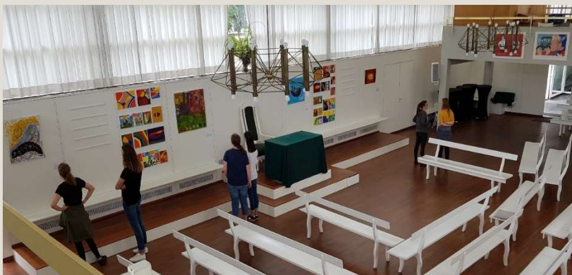
Ausstellung anlässlich des Jubiläums

Dies war der Titel unserer Ausstellung zum 10jährigen Jubiläum von SOLWODI Berlin, das wir dieses Jahr begehen. Die Jubiläumsfeier fand am 24. Mai 2018 im lichtdurchfluteten Gemeindesaal der Herrnhuter Brüdergemeine in Neukölln statt, die uns die Räume großzügig zur Verfügung stellten, auch für die dreiwöchige Ausstellung, die in dieser Feier eröffnet wurde.