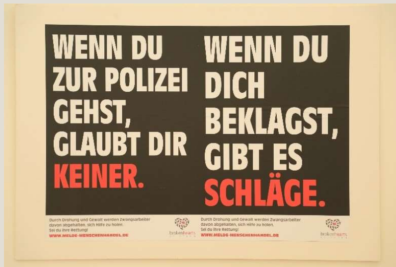
Plakat der broken hearts stiftung (©Luke Sonnenglanz)