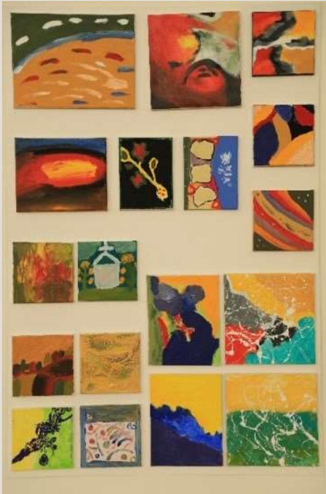
Von den Frauen gemalte Bilder

... strahlte aus den von den Frauen gemalten Bildern 1 Licht und Leben. Es sind vielleicht keine besonderen Kunstwerke, aber sie sprechen und lächeln und lassen die Kraft der Auferstehung erahnen.